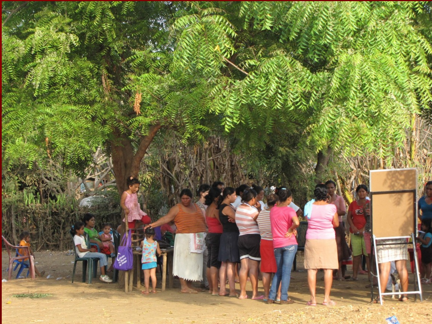
Selbsthilfegruppen von Frauen